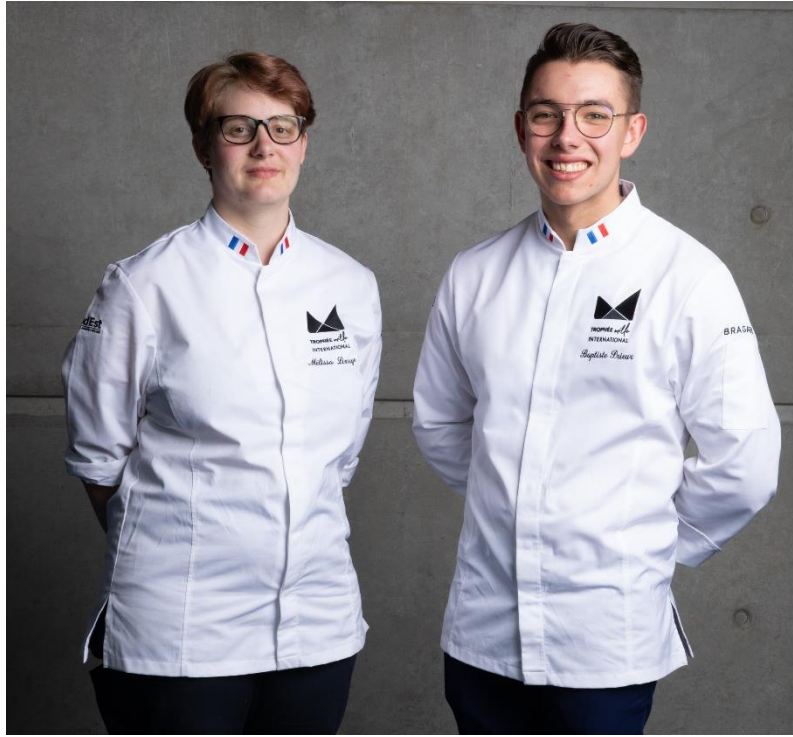
PHOTO DES CANDIDATS PARTICIPANTS